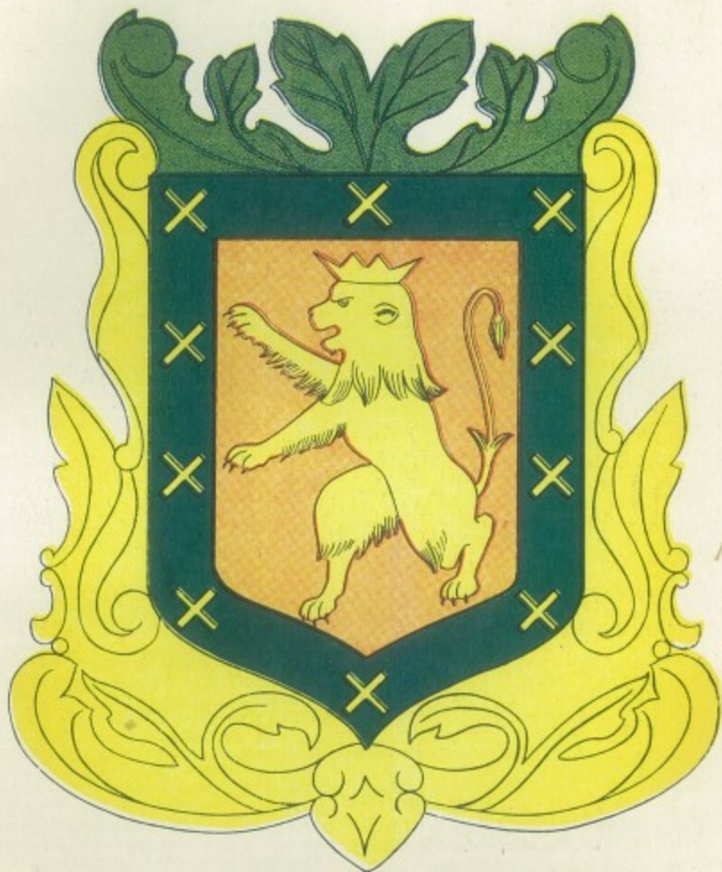
ESCUDO DEL ESTADO DE OAXACA