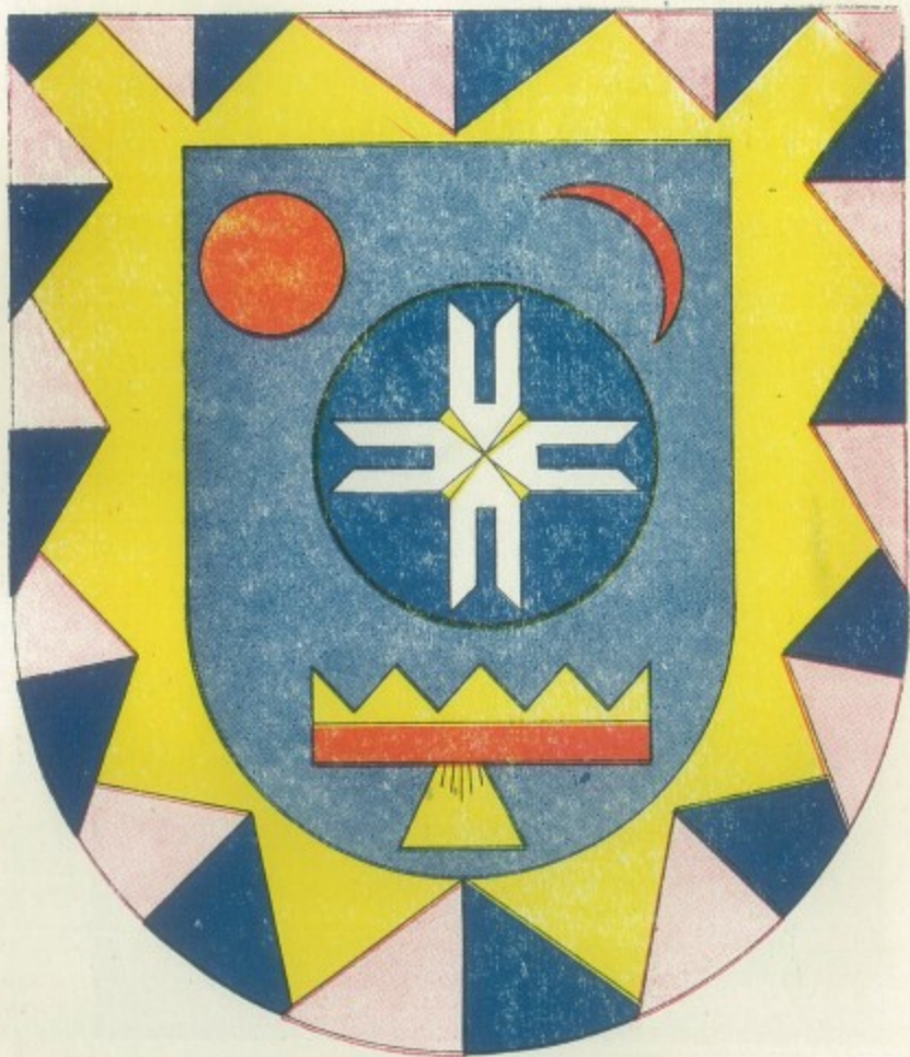
ESCUDO DEL ESTADO DE NAYARIT