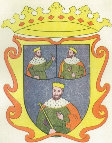
ESCUDO DEL ESTADO DE MICHOACAN