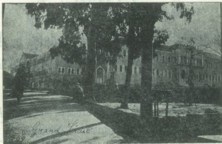
El Palacio Presidencial en la Capital de la República Libanesa.