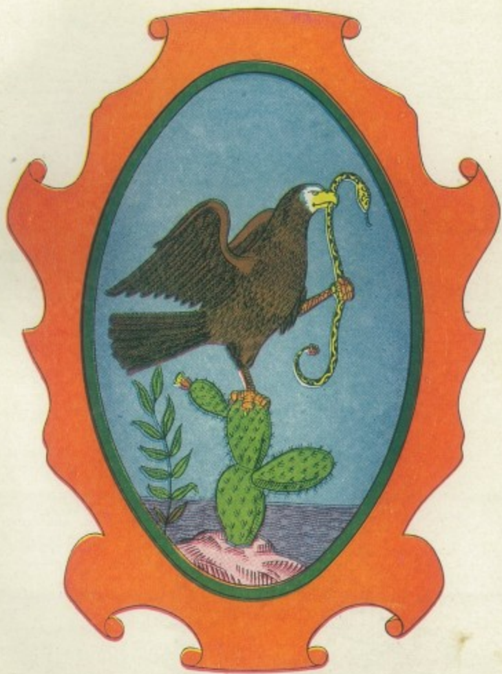
ESCUDO DEL ESTADO DE MEXICO