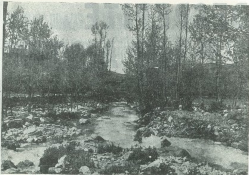
Un pintoresco paisaje de Libano.