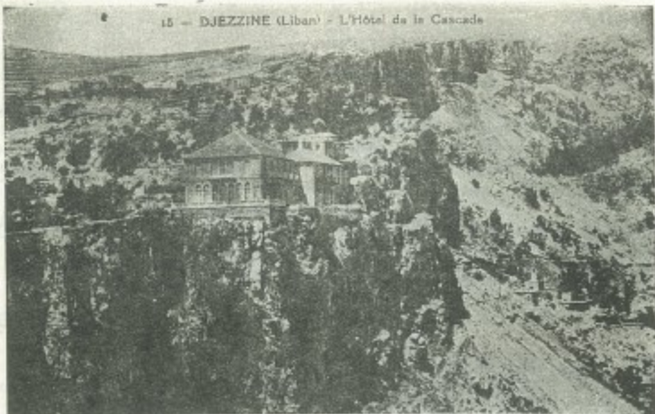
La pintoresca y bella ciudad de Djezzín, Líbano. En esta gráfica aparece el moderno hotel de "La Cascada" que domina un hermoso panorama.