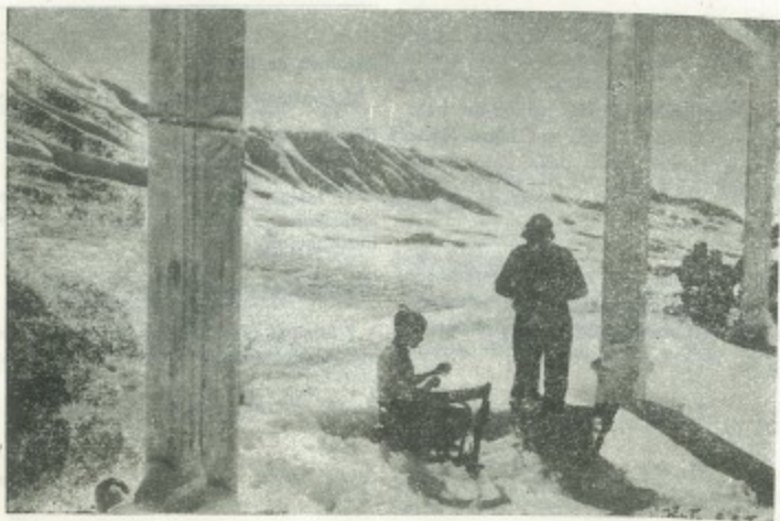
Esquiadores libaneses en las altas montañas que circundan los cedros, sitios propios para este saludable deporte.