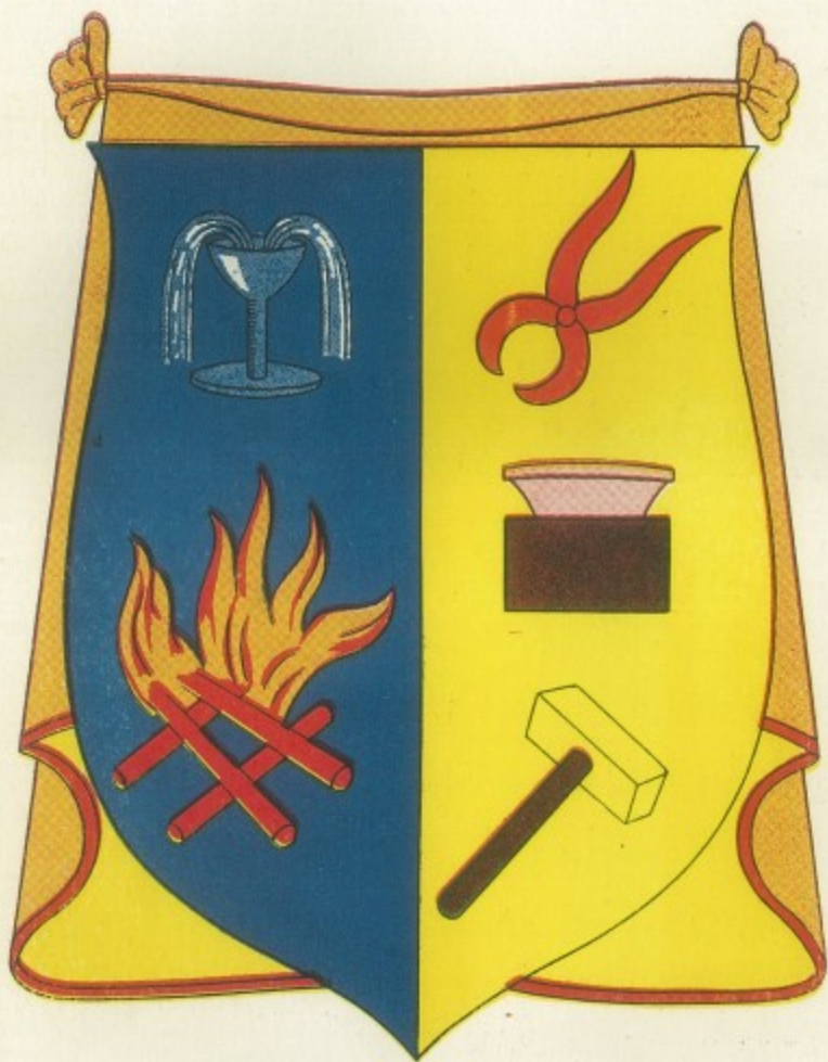
ESCUDO DEL ESTADO DE AGUASCALIENTES