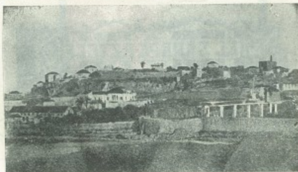
AMIUN, ciudad muy interesante, cabecera del Dto. de Al Khura.

5 familias, c/30 personas, 5 comerciantes y 3 casados con mexicana, 1 Nacionalizado.